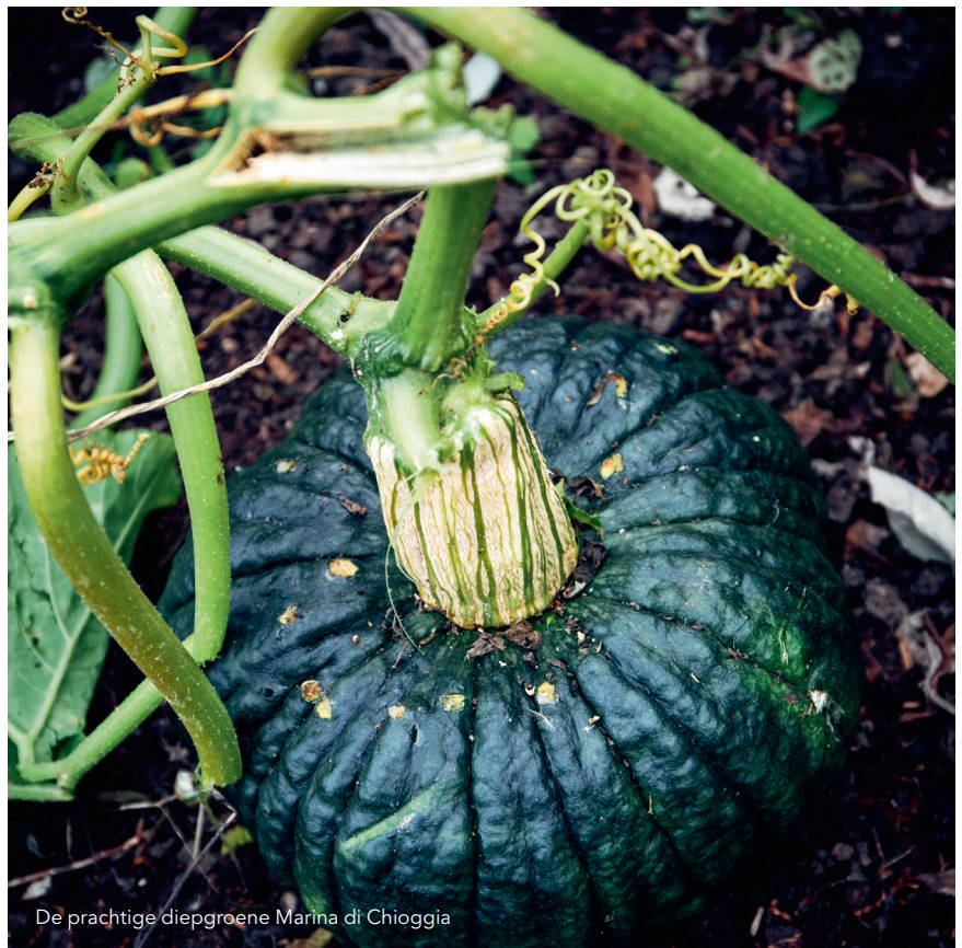
De prachtige diepgroene Marina di Chioggia